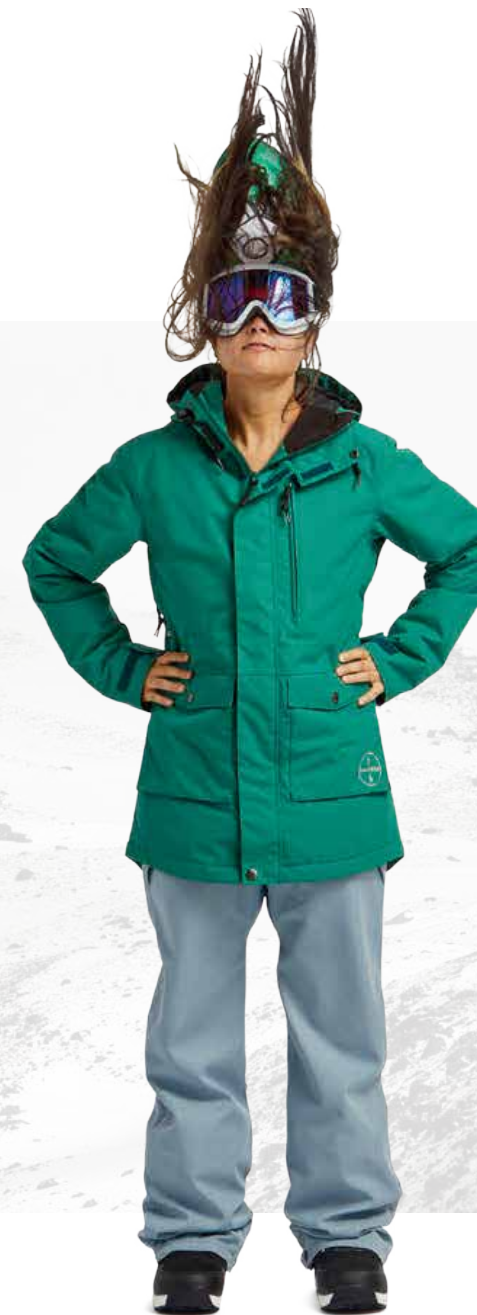
STAY WILD PARKA / SURF PINE W'S FREEDOM BIB / DARK SKY