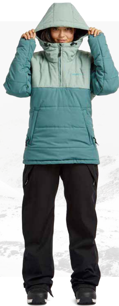
PUFFIN PULLOVER / ATLANTIC W'S FREEDOM BIB / BLACK