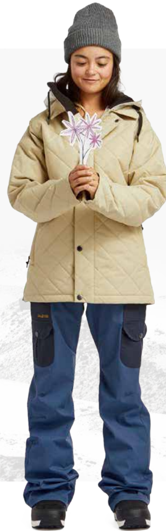
W'S WORK JACKET / SAND STAY WILD PANT / NAVY