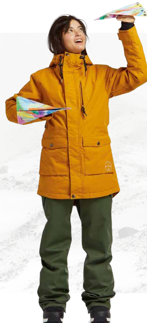
STAY WILD PARKA / DARK GOLD W'S FREEDOM BIB / LIZARD