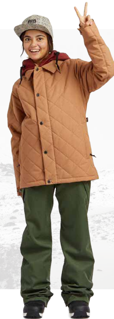
W'S WORK JACKET / ADOBE W'S FREEDOM BIB / LIZARD