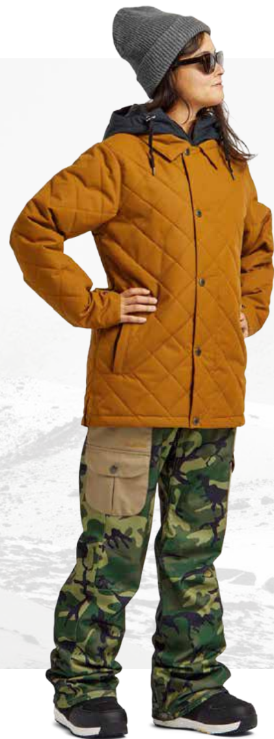
W'S WORK JACKET / GRIZZLY STAY WILD PANT / OG DINO