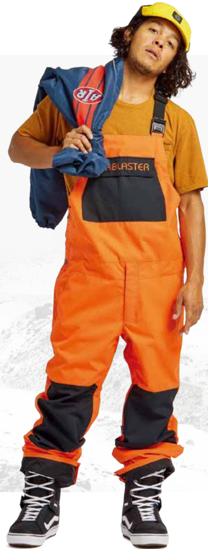
REVERT JACKET / NAVY FREEDOM BIB / FLAME