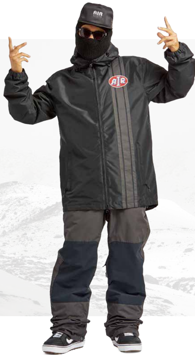
REVERT JACKET / BLACK FREEDOM BIB / VINTAGE BLACK