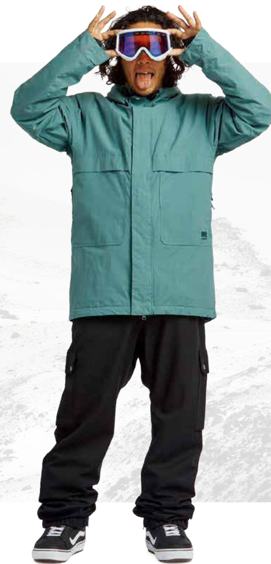
BLASTER PARKA / ATLANTIC FREEDOM BOSS PANT / BLACK