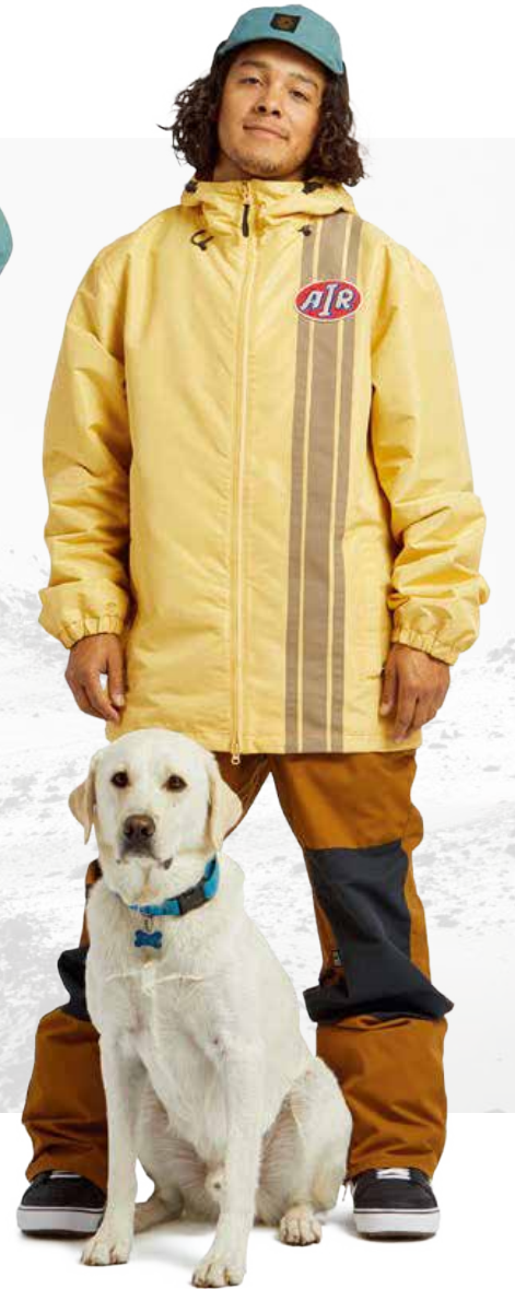
REVERT JACKET / BANANA FREEDOM BIB / GRIZZLY