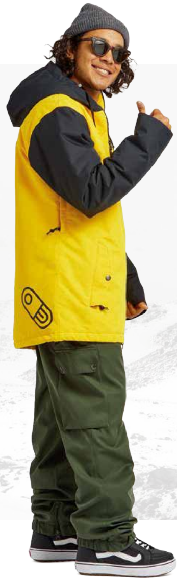
TOASTER JACKET / YOLO FREEDOM BOSS PANT / LIZARD