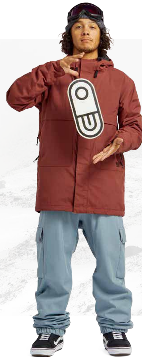
BLASTER PARKA / OXBLOOD FREEDOM BOSS PANT / DK SKY